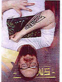
8-9 • Nöje

Storpublik när Hofsorsbo datorspelade på Stortorget