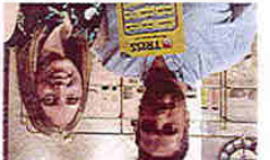
6 • Nyheter

Gävlebon skrapade fram kvarts miljon i tv