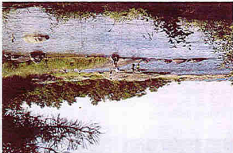
Ångskärs havscamping ligger på kusten utanför Skärplinge i Tierps kommun. Markerat i rött på kartan.